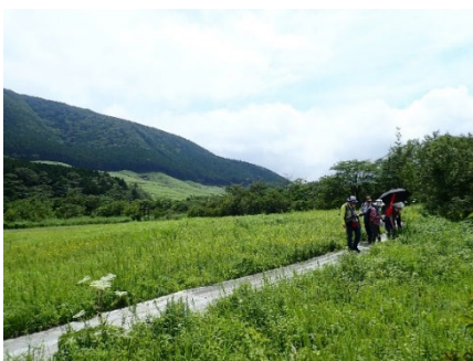
湿原保全実験区での観察の様子